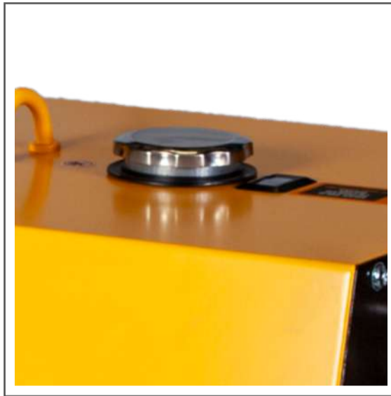
Carga de combustible y medidor