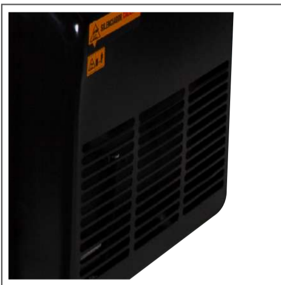
Salida de escape