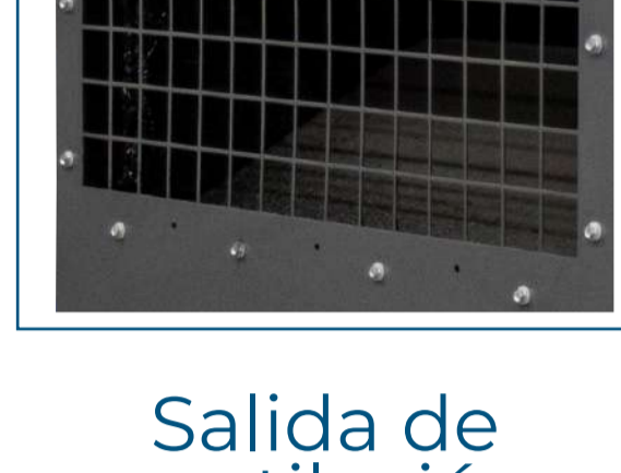
Salida de ventilación