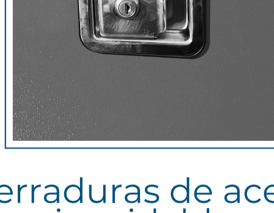
Cerraduras de acero inoxidable