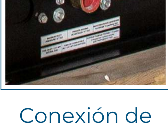
Conexión de gas