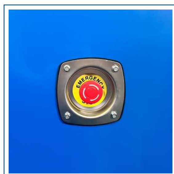
Parada de emergencia