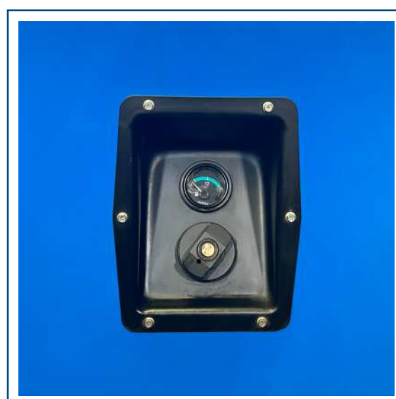
Carga de combustible externa con medidor