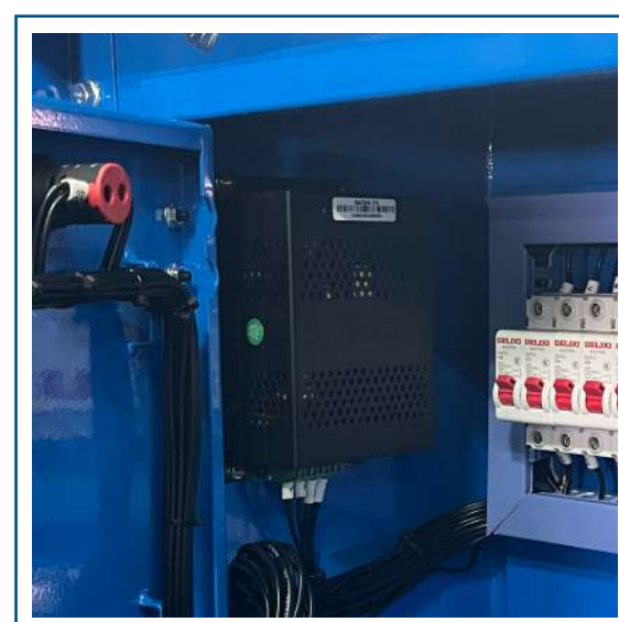
Cargador de batería